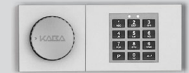
Elektronisches Kombinations- schloss - B 30