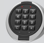
Elektronisches Kombinationsschloss - Primor 3000 level 5