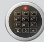
Elektronisches Kombinationsschloss - Solar Business